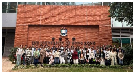
参访交流：香港大学