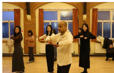
莎莎舞教学与联谊